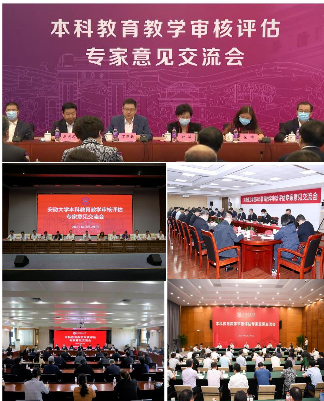
图 2：5 所试点高校专家意见现场交流会

审核评估报告，通过专家入校靶向查证、深度问诊，最终形成问题总计 169 个。其中，第一类 2 所试点高校问题共 48 个，第二类 3 所试点高校问题共 121 个。